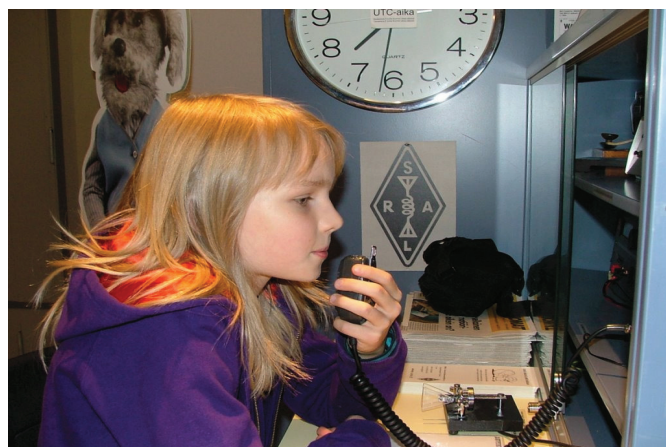
Kuva: 800 koululaista ja opettajaa sai ensituntuman radioamatööritoimintaan kerhon koululaisesittelyissä

Lahden kaupungin koulutoimi päätti, että kaupungin kaikkien peruskoulujen 4.-luokkalaisten tulee vierailla Radio- ja tv-museolla osana koulun kulttuurikasvatusta. Kerholle tarjoutui tilaisuus antaa apua museolle esittelemällä radioamatööritoimintaa OH3R:n asemalla.